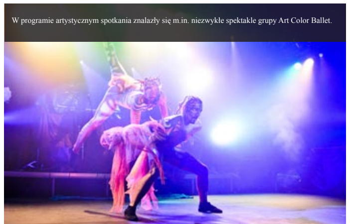
W programie artystycznym spotkania znalazły się m.in. niezwykle spektakle grupy Art Color Ballet.