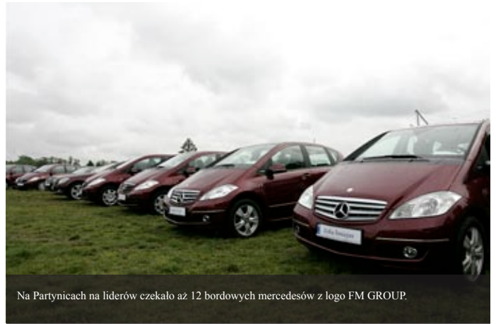
Na Partynicach na liderów czekało aż 12 bordowych mercedesów z logo FM GROUP.