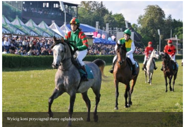
Wyścig koni przyciągnął tłumy oglądających.