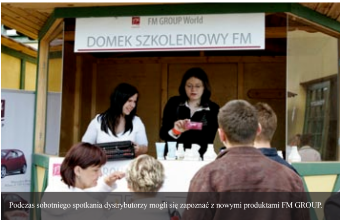
Podczas sobotniego spotkania dystrybutorzy mogli się zapoznać z nowymi produktami FM GROUP.